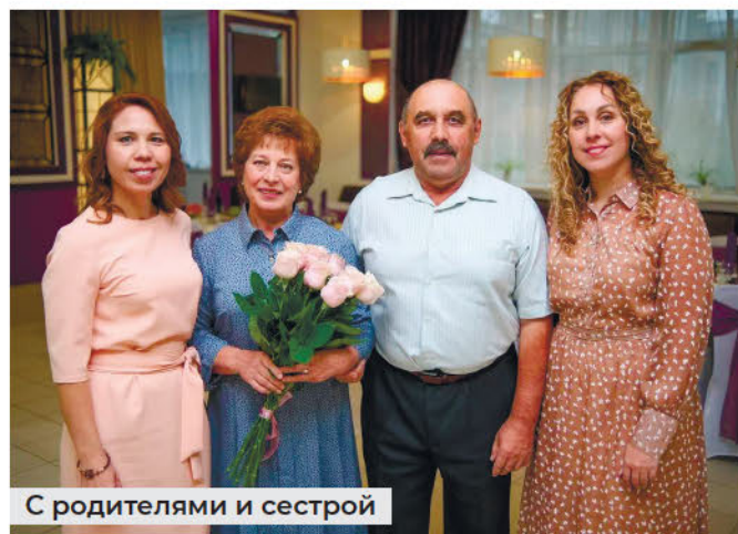
С родителями и сестрой

– Это интересно. Я пришла на эту должность осознанно и уверена, что всё получится. Мне нравится сам процесс общественно-политической работы, нравится помогать людям, реализовывать проекты. В общественной работе я с 2020 года, была и организатором, и куратором, и волонтером. Моя мама уже три года у себя в посёлке вместе с другими женщинами плетут маскировочные сети, собирают посылки для бойцов. Знакома со многими общественными организа-