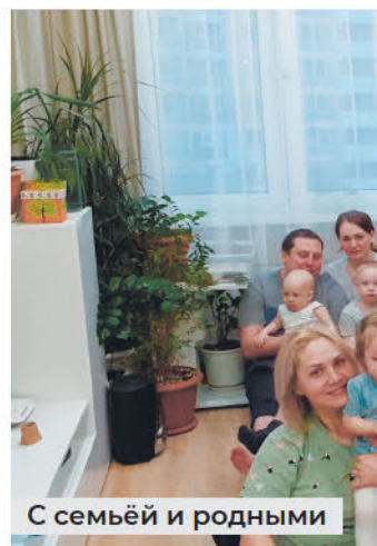
С семьёй и родными

– Конечно. Как в обычной деревенской семье. Забот, ежедневной работы всегда хватало. Поэтому и грядки положили, и дрова носили, чтобы печку топить, в доме прибирались. Воспитывались в труде. Детям своим часто рассказывала, что вместо поездок на море у нас каждое лето был сенокос. Сплавлялись по реке на лодке каждое утро на протяжении месяца-двух, брали с собой весь инвентарь и с утра до вечера вместе с родителями за-