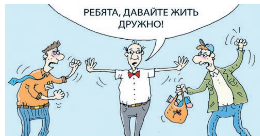
ИЛЛЮСТРАЦИЯ СЕРГЕЯ КОЧАРОВА / CARTOONVALENTIN.RU

П осле проверки более 4 тысяч продовольственных товаров специалисты Роскачества утверждают: наличие на упаковке знака ГОСТ не гарантирует доброкачественного продукта. Часте за этим кроется желание продавца сыграть на чувстве нестальгии, присутствующем у наших покупателей. Четыре буквы у людей старшего поколения почему-то до сей поры ассоциируются с чем-то настоящим, под-