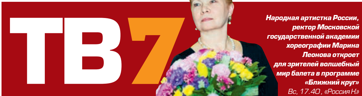
Народная артистка России, ректор Московской государственной академии хореографии Марина Леонова открывает для зрителей волшебный мир балета в программе «Ближний круг» Вc, 17.40, «Россия Н»